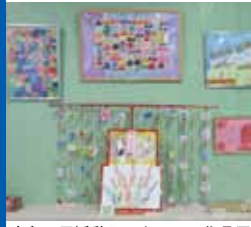
大和区民活動センターでの作品展