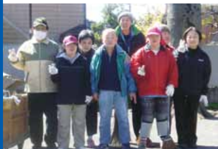
"明るく、楽しく"がチームワークの源です

杉の子大和では毎日の作業以外にも、行事・クラブ活動も積極的に実施しています。絵画や工作の作品は、大和区民活動センターでも展示されます。