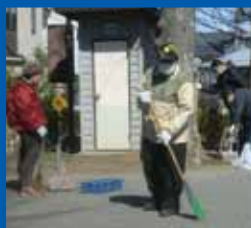
公園の清掃、いつもありがとう!