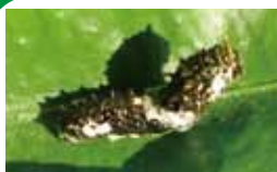
鳥の糞時代は幼稚園から小学生