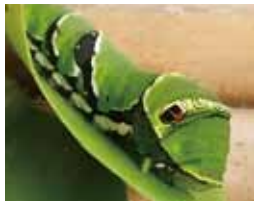
緑色になったら中・高生