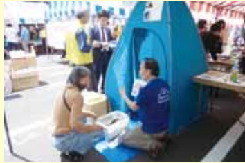
*展示名は仮称、展示期間は変更になる場合もあります。

今回は最近注目を集めている「災害時のトイレ」の説明や、防災を考えるグループ「上高田住民フォーラム」の紹介、野方消防署から「熊本地震写真」が展示されます。9月7日(水)には「防災相談」を実施します。