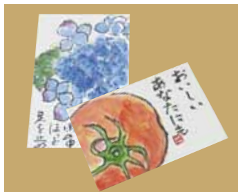
ステキな作品ですね!