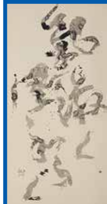
令和元年「〈第36回〉産経国際書展」で最高賞「高円宮賞」の受賞作品