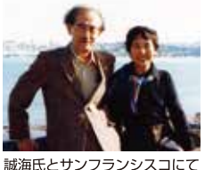
誠海氏とサンフランシスコにて