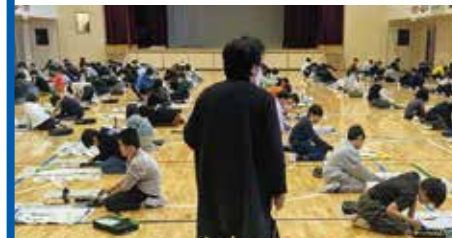
昨年、美鳩小学校で開催した「書き初め指導」

母校の美鳩小学校で140名の生徒さんたちに書き初めの指導を行いました。これからも、私の出来ることで大和町に貢献したいと思っています。