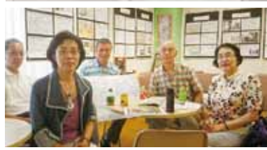
▼「大和町の棟方志功展」に来られた富山県福光町の学芸員の方と共に