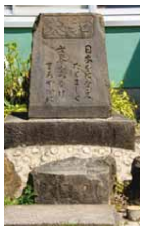
大和小学校にあった大和の碑

大和小学校にあった「大和の碑」の石材は、鹿鳴館の跡地に本社があった大和生命保険が、大和小25周年を迎える際に鹿鳴館正門の礎石25個を寄贈したものです。