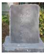
美鳩小に設置予定の碑「大和校われらが母校」

平成29年4月、大和小と若宮小の統合・美鳩小学校開校により「大和の碑」は撤去するとの発表がありました。そこで大和町歴史編集委員会が中心となり「大和町文化財を守る会」を立ち上げ、関係各所との折衝を重ねた結果、礎石を左記の形で保存することが決まりました。