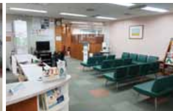
清潔な待合室と受付