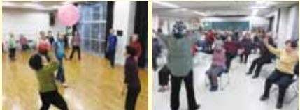
■問合せ/大和区民活動センター運営委員会事務局