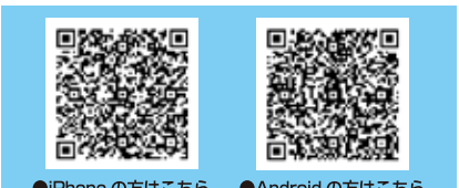
●iPhoneの方はこちら ●Androidの方はこちら

収集日カレンダーやごみ分別辞典など、使いやすい便利な機能が盛りだくさん！下記二次元コードから無料でダウンロードできます。(※通信料は利用者負担です)