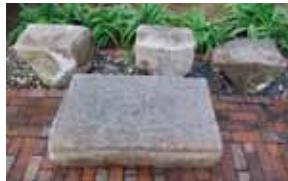
会員宅で保存されている礎石