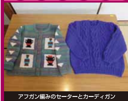
アフガン編みのセーターとカーディガン